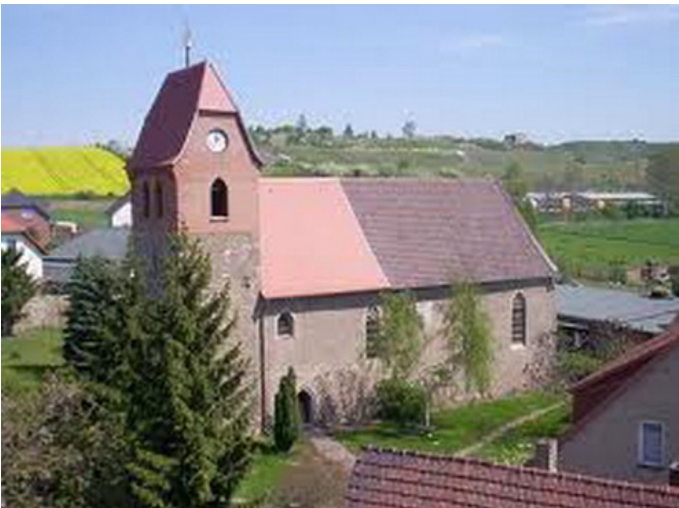
Kirche Unterrißdorf Autor Diethelm Schmolke Dr. Quelle Wanderbewegung Magdeburg e.V.