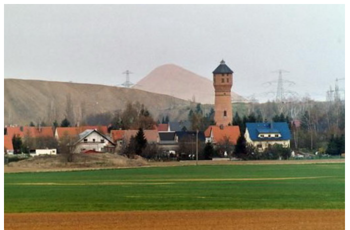
Wasserturm Klostermansfeld Autor Diethelm Schmolke Dr. Quelle Wanderbewegung Magdeburg e.V.

TRANSROMANICA The Romanesque Routes of European Heritage