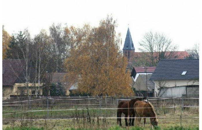
Klostermansfeld Autor Diethelm Schmolke Dr. Quelle Wanderbewegung Magdeburg e.V.