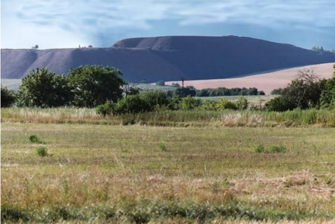
Halden-Landschaft Autor Diethelm Schmolke Dr. Quelle Wanderbewegung Magdeburg e.V.