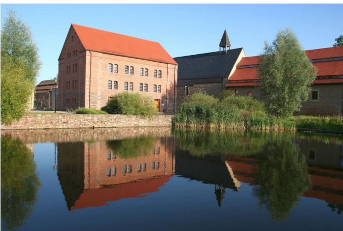
Kloster Helfta Autor Eichler Ekkehart Quelle Eichler Ekkehart