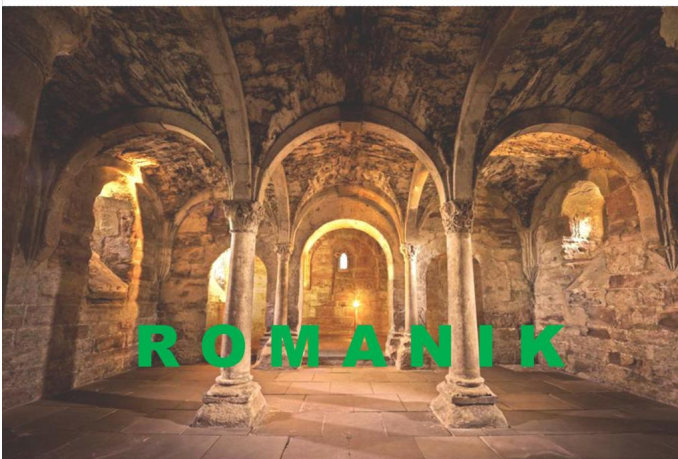
Tour der Romanik Autor Andreas Stedler Quelle Investitions- und Marketinggesellschaft mbH (IMG)