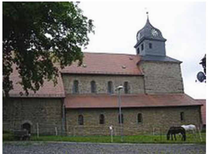
Klosterkirche Klostermansfeld Autor Diethelm Schmolke Dr. Quelle Investitions- und Marketinggesellschaft mbH (IMG)