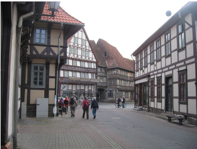
Fachwerkstadt