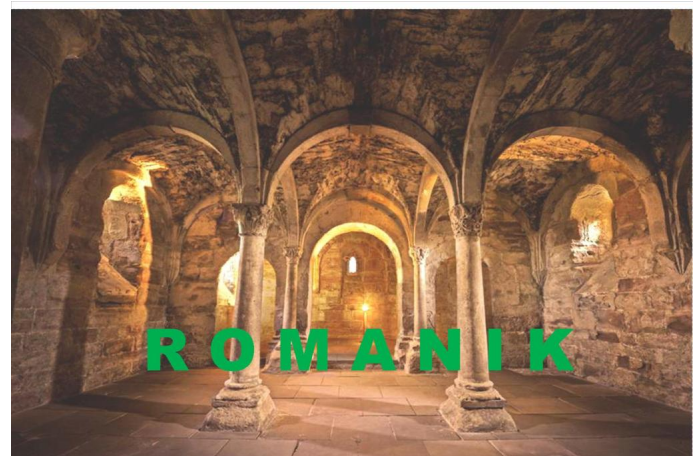
Tour der Romanik Autor Martin Fricke