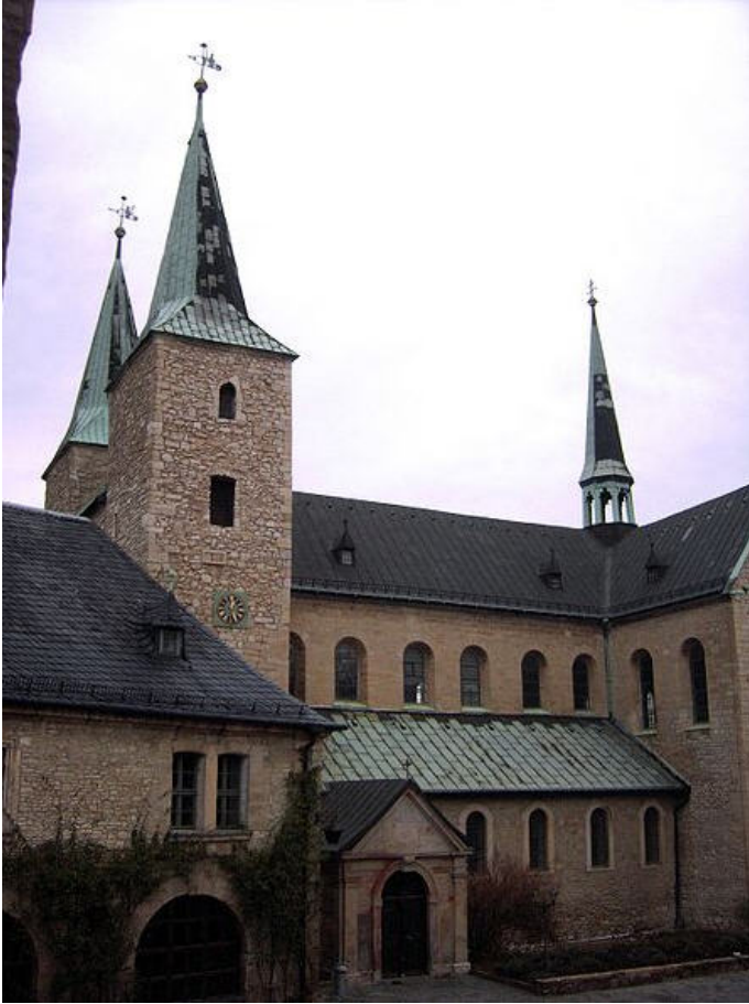
Huysburg Autor Diethelm Schmolke Dr. Quelle Wanderbewegung Magdeburg e.V.