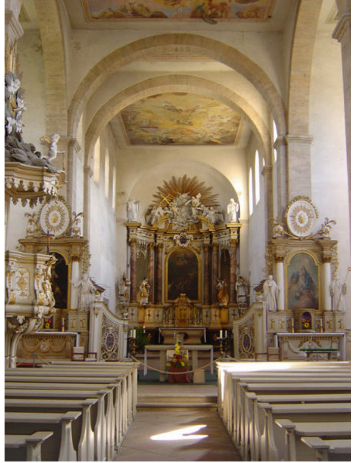
Kirche Huysburg