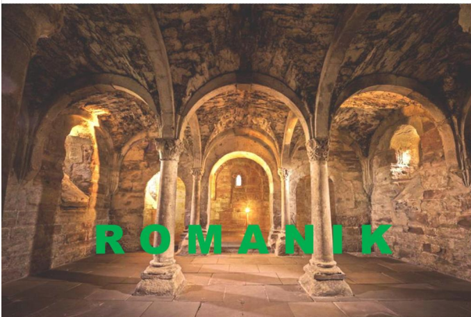
Tour der Romanik Autor Andreas Stedler Quelle Investitions- und Marketinggesellschaft mbH (IMG)