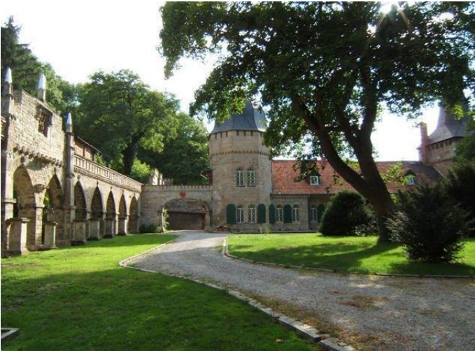
Schloß Röderhof