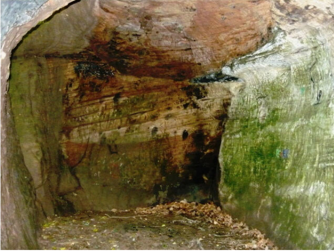
Daneilshöhle innen