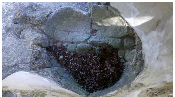
Gletschertöpfe Autor Diethelm Schmolke Dr. Quelle Wanderbewegung Magdeburg e.V.