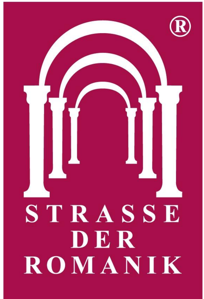
Logo Straße der Romanik